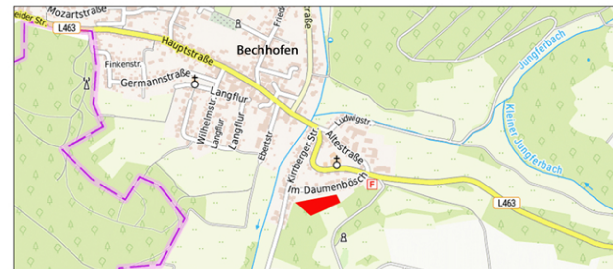
Lageübersicht (ohne Maßstab)